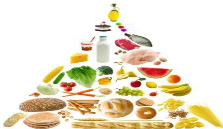
Obrázek 1 Výživová pyramida